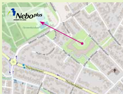
Locatie Nebo, Johan de Wittlaan 12, 3771 HP Barneveld

Voor vragen, opmerkingen en tips kunt u altijd contact opnemen. Kijk voor de actuele bestuurssamenstelling, adres- en contactgegevens van Stichting Vrienden van Neboplus op www.neboplus.nl (onder 'wie zijn we').